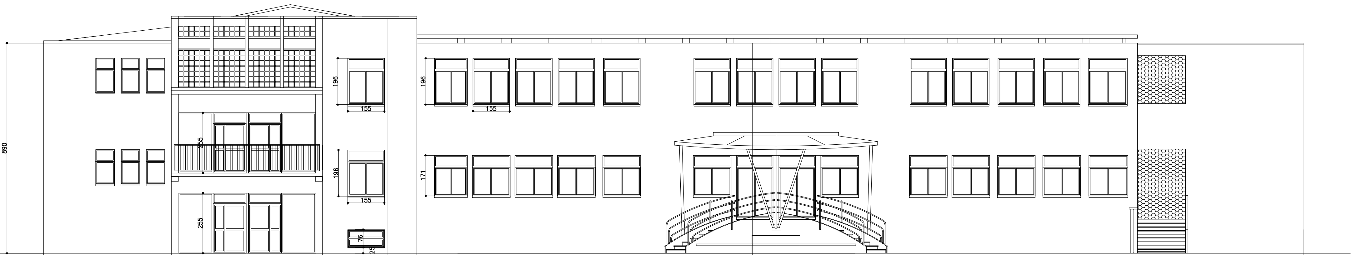
PROSPETTO OVEST _PROGETTO

NUOVO FALDALE IN LAMIERA sviluppo 90 cm. muro senza cappotto ( su copertura piana) con piego per gocciolatoio