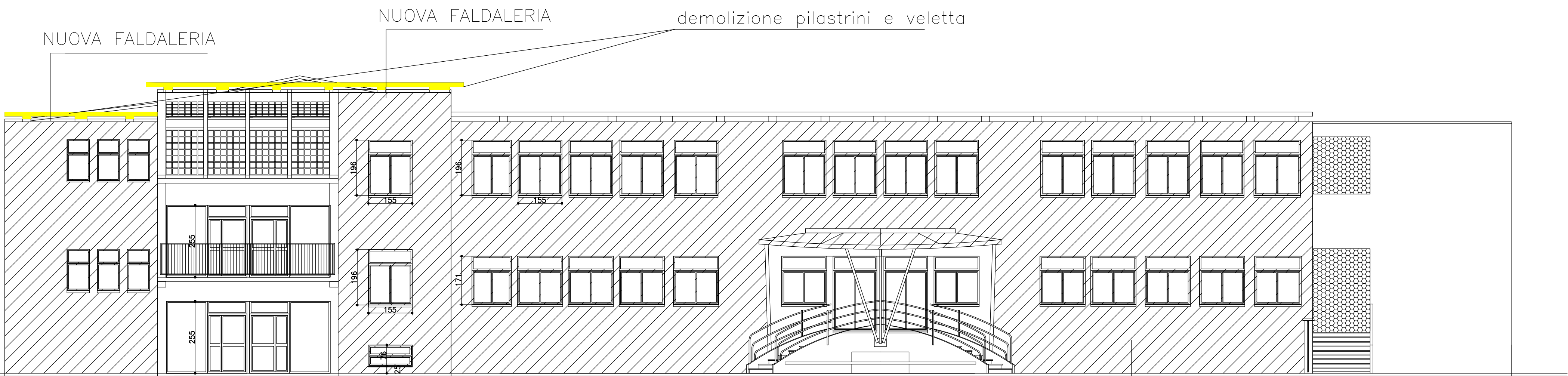
PROSPETTO OVEST _DEMOLIZIONI E RICOSTRUZIONI