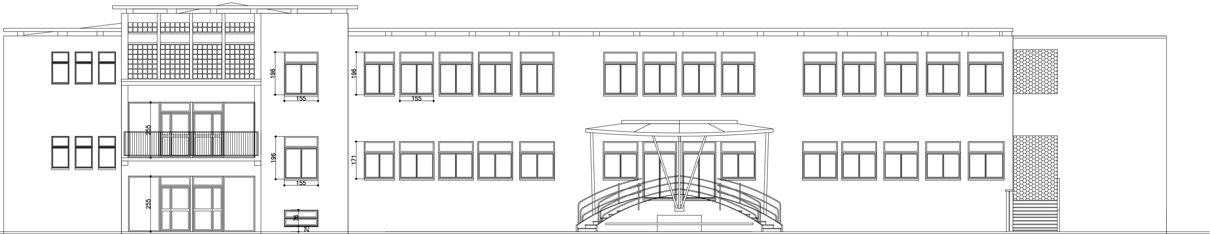
PROSPETTO OVEST _ESISTENTE